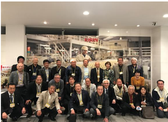
麒麟ビール工場へ